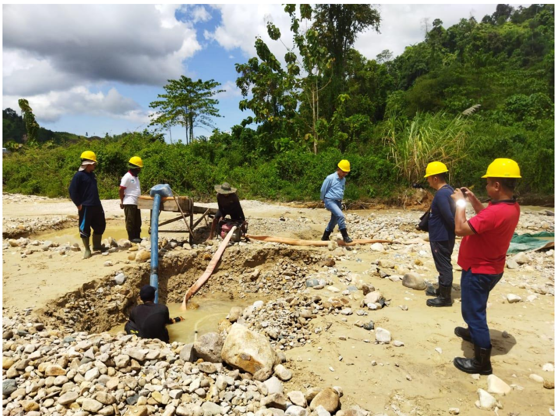
Verifikasi PNBP PT. Gorontalo Sejahtera Mining