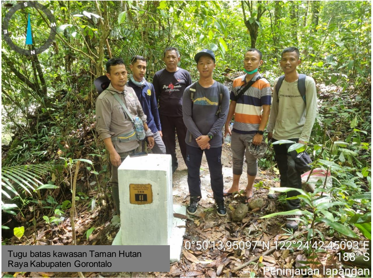
Tugu batas kawasan Taman Hutan Raya Kabupaten Gorontalo

0°50'13,95097"N 122°24'42,45093"E 188° S Peninjauan lapangan