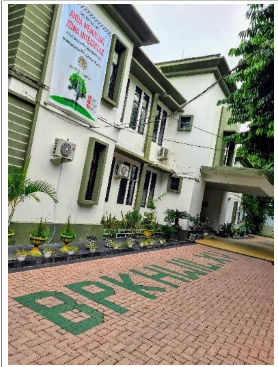
Gambar 1. Gedung Kantor Balai Pemantapan Kawasan Hutan dan Tata Lingkungan (BPKHTL) Wilayah XV Gorontalo