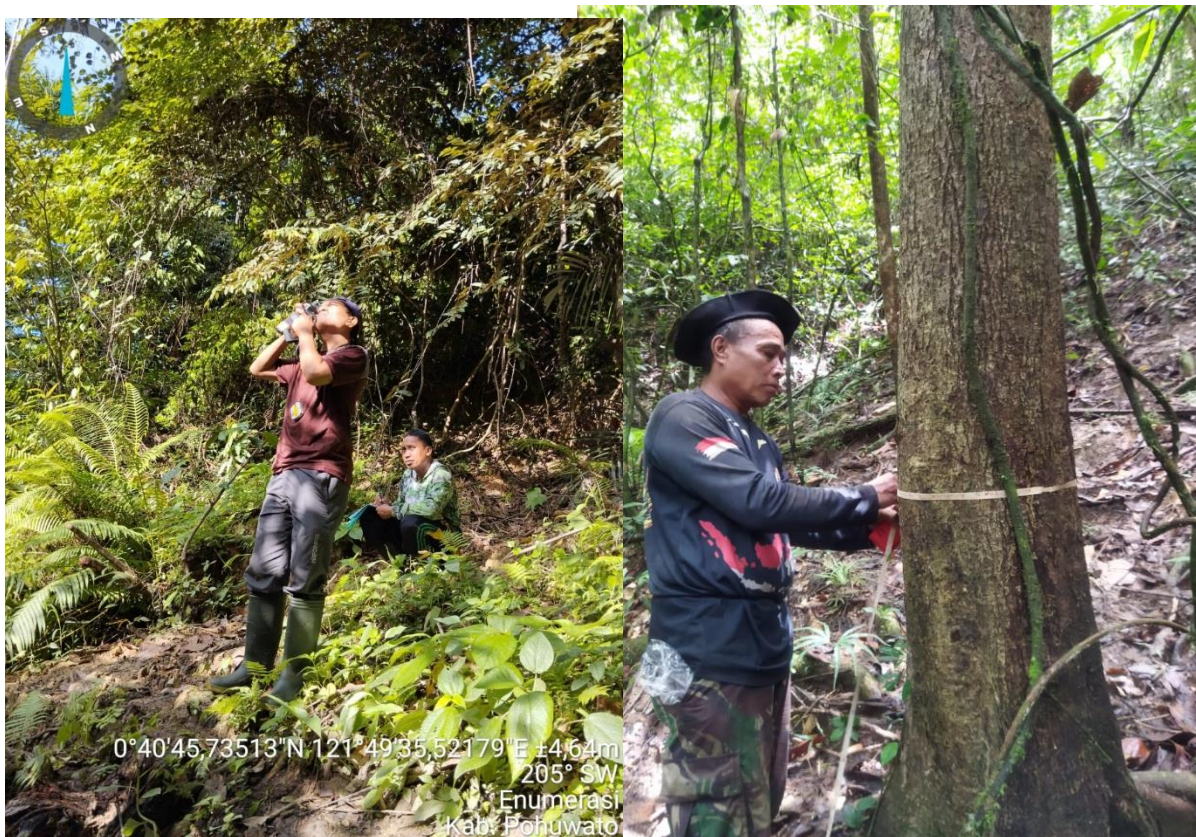
Enumerasi TSP/ PSP di Kabupaten Pohuwato