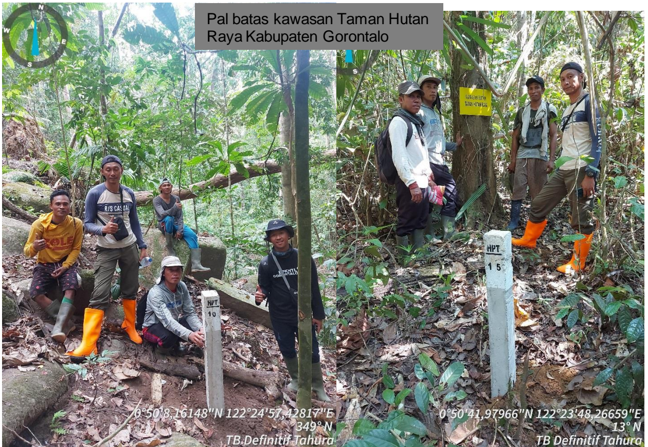
Pal batas kawasan Taman Hutan Raya Kabupaten Gorontalo

0°50'13,95097"N 122°24'42,45093"E 188° S Peninjauan lapangan