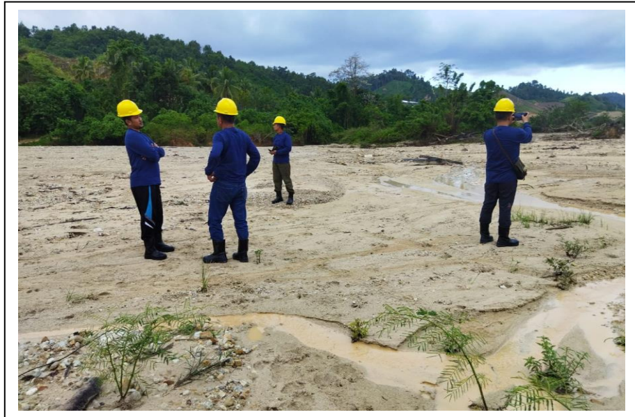
Gambar 3. Kegiatan Verifikasi PNBP